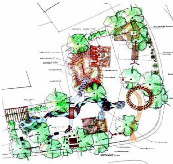
Naturnaher Abenteuerspielplatz öffentliche Maßnahme der Arbeitsgruppe „Wohnen & Wohnzufriedenheit“ Steffeln 1997